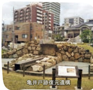
亀井戸跡復元遺構