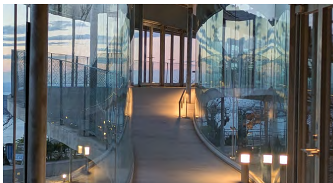
自然との一体感を感じる空間