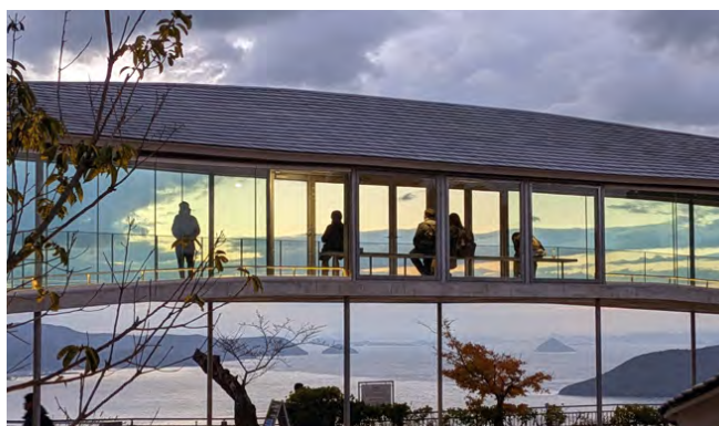
やしまーる目の前には、瀬戸内の多島美が広がる

2022年夏、屋島山上にオープンした“やしまーる”。ガラス張りの回廊型建物で、時間や季節によって変化する自然との一体感が感じられる空間になっています。展望スペースからは瀬戸内海の多島美、高松市街の絶景が広がります。源平合戦をモチーフに、絵画とジオラマを組み合わせ制作されたパノラマアート「屋島での夜の夢」は、日本唯一のパノラマ館です。高松の新スポット“やしまーる”で贅沢な時間を過ごしてみませんか？