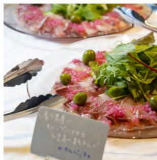
オプション「ケータリング」