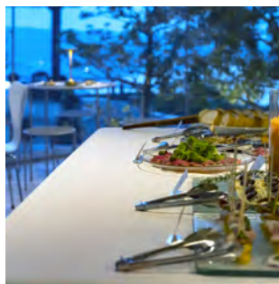
オプション「ケータリング」