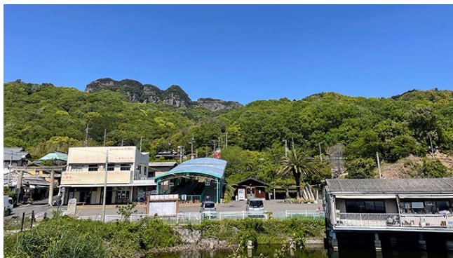
八栗ケーブル 登山口駅