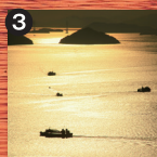
3 サンセット 大槌島・小槌島を背景に鑑賞できるサンセットは絶好の撮影スポットです。