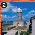
2 男木島灯台 120年の歴史を持つ、全国にも珍しい無塗装・庵治石造りの灯台は迫力満点。