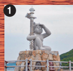
1 女木鬼灯台 女木島は別名「鬼ヶ島」と呼ばれ、港の入口では鬼の灯台がお出迎えます。