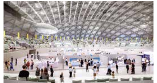
Copyright (C) 2021 Kagawa Prefectural Government and SANAA. All rights reserved.

開館日には、県民の皆様とともに開館を祝う記念式典を開催するほか、開館後は、県民の皆様がアリーナを体感していただく県民参加型イベントや、人気アーティストのコンサートなど、魅力的なイベントの開催が多数予定されています。